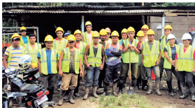
Equipo de trabajo de la Comunidad Malécu que participó en la construcción de la ampliación del acueducto.

Las siguientes comunidades se verán beneficiadas gracias a la donación de US$ 20 millones de dólares a través del Fondo Español de Cooperación de Agua y Saneamiento para América Latina y el Caribe (FECASALC) bajo la supervisión del Banco Interamericano de Desarrollo (BID).