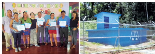
Primer taller de capacitación "Elementos Básicos de Administración de Acueductos".