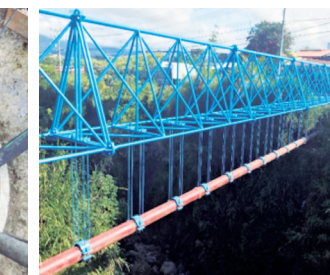
Construcción puentes canales para soportar tubería hierro dúctil en cruces de río.

CONTACTENOS: Trabajamos para mejorar las condiciones ambientales y ampliación en servicios de agua potable. En caso de mayor información puede contactarse al correo: paps@aya.go.cr / Teléfonos: (506) 2242-5234 / (506) 2242-5349 / www.mejoramientoambiental.com UNIDAD EJECUTORA PROGRAMA DE AGUA POTABLE Y SANEAMIENTO (PAPS)