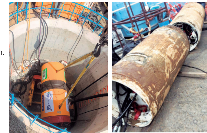
Equipo de microtuneleo de 600 mm y 1200 mm.