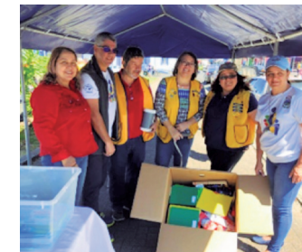
Actividad Parque Vázquez de Coronado

Las comunidades involucradas previo, durante y al finalizar las obras reciben información del proyecto, coordinando al mismo tiempo charlas de sensibilización con grupos organizados y la participación en actividades desarrolladas en los cantones a través de Asociaciones de Desarrollo y coordinación con las Municipalidades. Paralelamente se realizan comunicaciones oficiales de las obras en ejecución en redes sociales del AyA y en las implementadas por las mismas Municipalidades y otros actores. En caso de requerir información en la comunidad, podrán solicitarlo al correo paps@aya.go.cr .