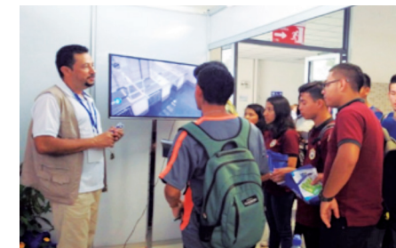
Explicación a participantes en la Feria del Ambiente