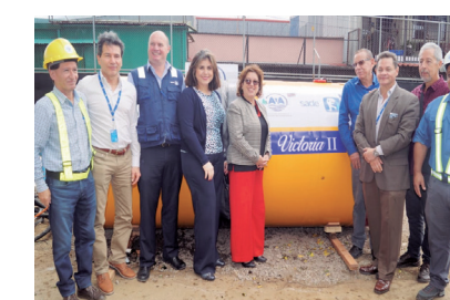
AyA y empresa SADE implementan microtuneleo.