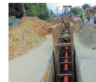
Método zanja abierta.

En el caso de Rutas Nacionales y de Travesía, los trabajos de instalación de tubería para cualquiera de los métodos mencionados, se desarrollan en horario diurno y nocturno, según los requerimientos constructivos y en concordancia con los respectivos permisos emitidos por el MOPT.