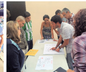
Ingeniero de AyA informa a la Comunidad Las Parcelas en Vázquez de Coronado sobre el proyecto en ese sector.