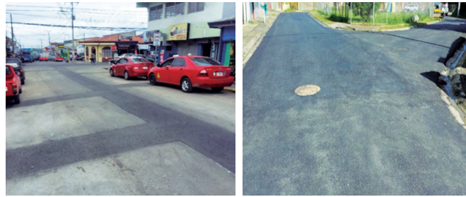
Reposición de pavimentos

La reposición de pavimentos, se realiza posterior al cumplimiento satisfactorio de las pruebas realizadas a las tuberías (prueba de hermeticidad, hidráulicas y de deflexión).