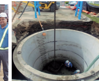
Construcción de pozos