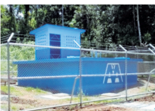
Tanque principal de almacenamiento y distribución en Malécu.